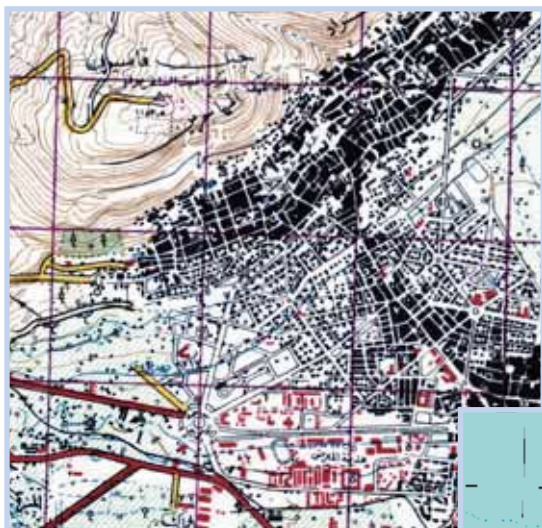
Global maps and geospatial data

EVCは幅広い分野の地形図、地質図、アトラス類、海洋図、衛星画像などあらゆる種類の空間データを所蔵しています。これらの原資料をもとに実に様々なデジタルデータを構築して供給するのです。これらはアメリカの国立空間データ局をはじめ、TLMs、JOGsなど他のデータのフォーマットにも準拠して最新の情報として作り出しています。