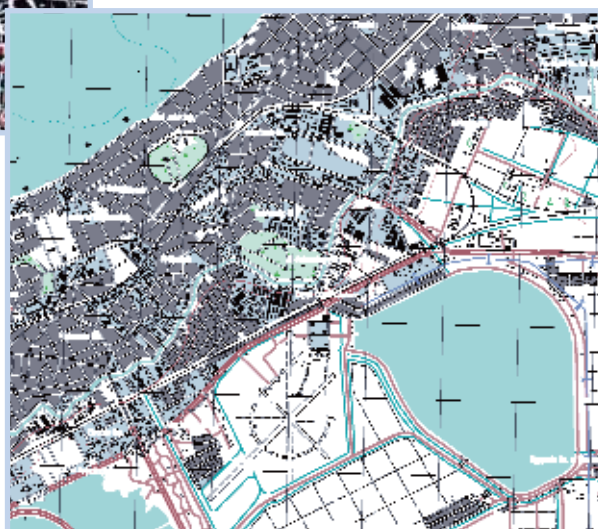
EVC-produced maps and data