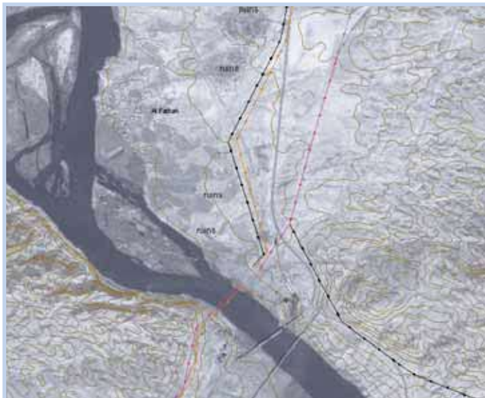
Feature extraction from satellite imagery